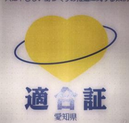
人にやさしい街づくりの推進に関する条例

この条例は、お年寄りや障害のある方を始め、だれもが安心して暮らし、気軽に出入りできる街をつかっていこうというものです。バリアフリー化、車椅子も入ることができるトイレ、浴室に手すりをつける等、そんな基準にあった建物だと承認されました。